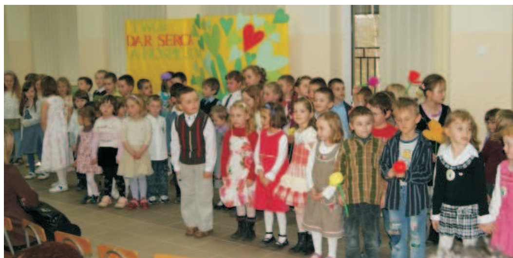
Młodzi artyści pomimo tremy świetnie radzili sobie na scenie.

Dnia 7 kwietnia odbył się wiosenny koncert w nowo otwartej sali w budynku OSP w Stróży. Licznie przybyli goście mogli podziwiać talenty wokalne, taneczne oraz aktorskie naszych przedszkolaków. Wszyscy młodzi artyści, pomimo tremy, świetnie poradzi sobie na scenie, o czym świadczyły gromkie brawa ze strony widowni. Wszyscy uczestnicy chętnie wspomagali naszą akcję i wrzu-