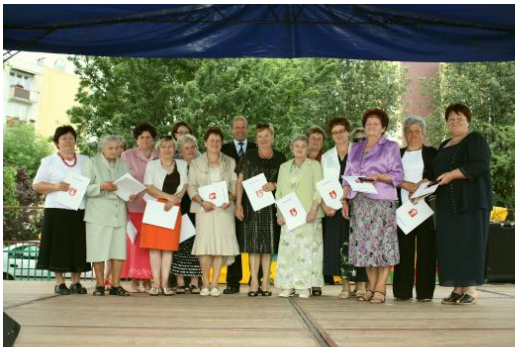
Wyróżnione Panie z Rady Kobiet