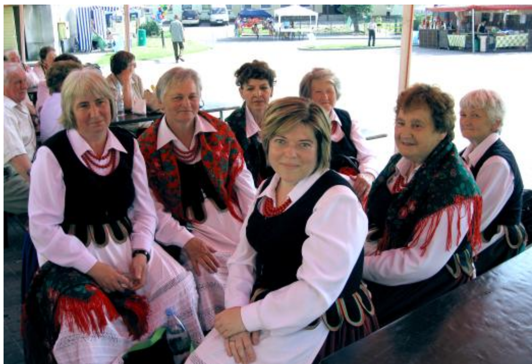
Kowalanki przed występem