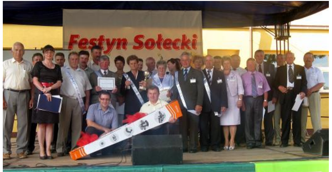
Na scenie sołtysi z kapitułą konkursową

W czci artystycznej publicznie gromkimi brawami nagrodziła występ zespołu „Dzierzkowacy”, kabaretu