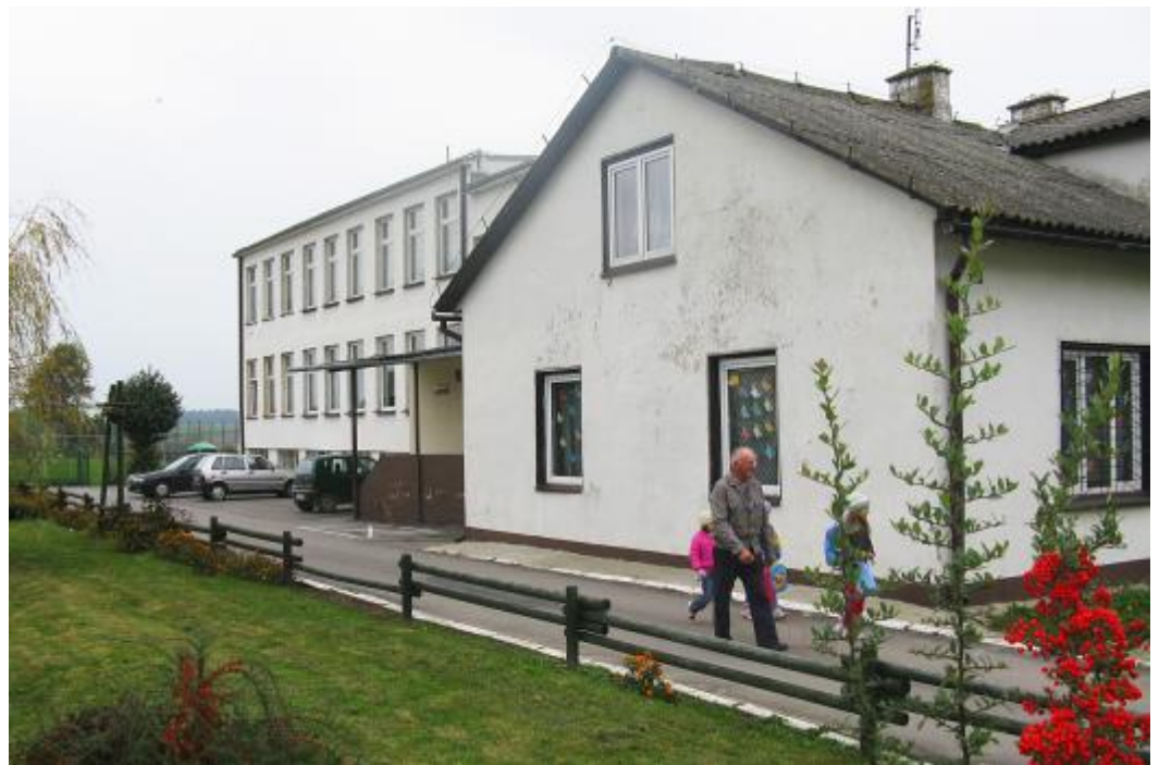
Szkoła Podstawowa w Kowalinie

Dyrekcja oraz kadra nauczycielska placówki oświatowej czyni starania aby