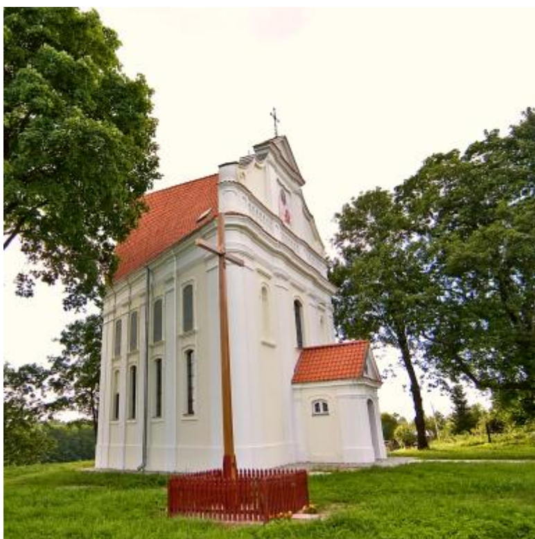
Odrestaurowana kaplica w Stróży

Zawsze lubię stare budynki - wywiad z ks. Grzegorzem Stankiem - str.3