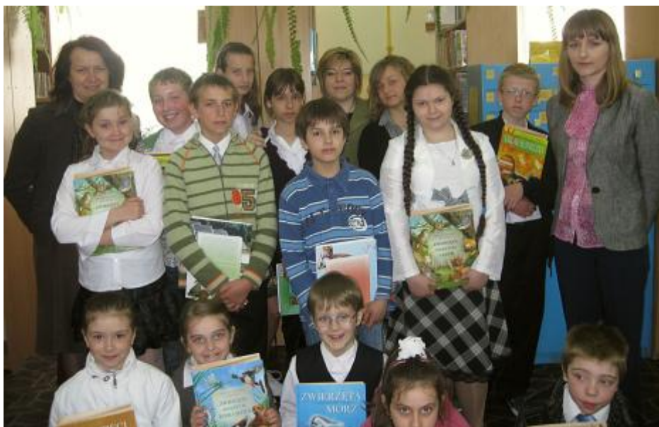
Laureaci Małego Konkursu Recytatorskiego z organizatorami