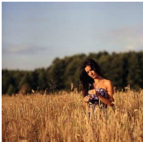
Na zdjęciu: ETNA – gwiazda tegorocznych Dożynek Gminnych